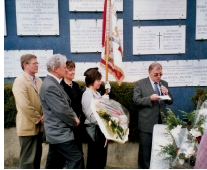
Delegacja EFPSN-T na Cmentarzu Polskim w Montmorency – czerwiec 2005 r.