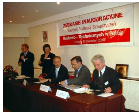
Podpisanie aktu założycielskiego EFPSN-T w Londynie – 23 kwietnia 2004 r.