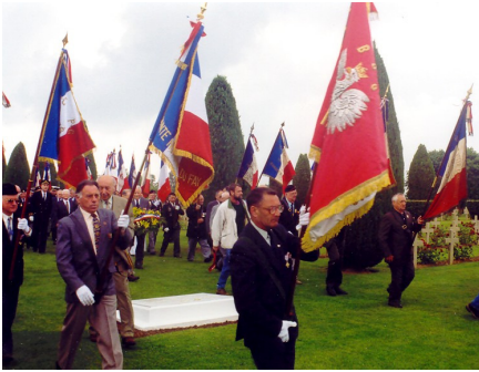
Doroczne święto 1 szej Polskiej Dywizji Pancerniej im. Gen. Maczka Urville-Langannerie – czerwiec 2001r.