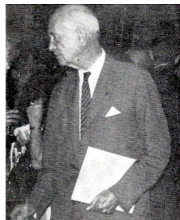
Książę André Poniatowski Prezydent Komitetu Honorowego Jubileuszu 50cio lecia SITPF