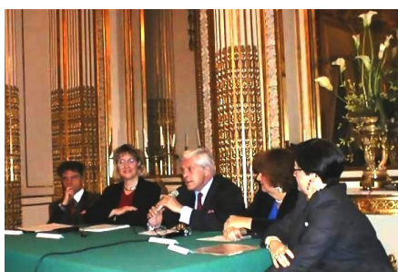
Debata w Ambasadzie RP w Paryżu pt. „Polska i Polacy w dzisiejszej Europie” z udziałem JE Ambasadora prof. Stefana Mollera – październik 2000 r.