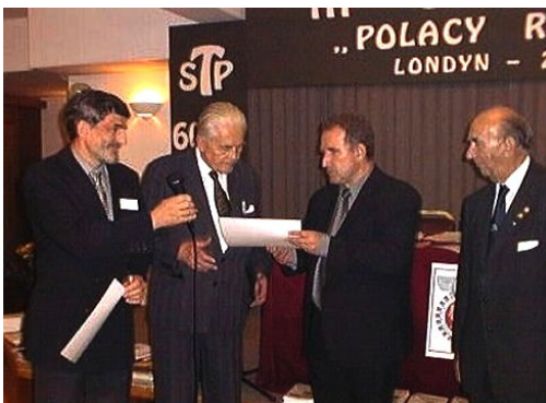
Symposium „Polacy Razem” Londyn - wrzesień 2000 r.