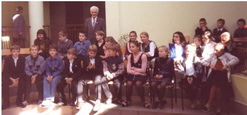
Dzieci w polskiej szkole w Wołkowysku - listopad 2000 r.