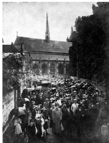
Pielgrzymka na Polski Cmentarz „Les Champeaux” w Montmorency 20-go maja 1917 r.

Akt założenia Polskiego Stowarzyszenia Techników został podpisany 18-go listopada 1917 roku ( Załącznik 1 ). Nowopowstałe stowarzyszenie wydało natychmiast „Odezwę” wzywającą polskich inżynierów do przyłączenia się do tej szlachetnej idei ( Załącznik 2 ).