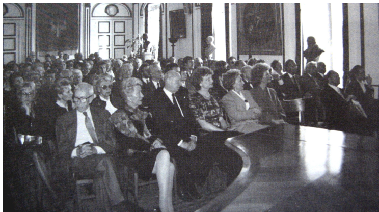
Uroczysta Sesja 75-cio lecia SITPF – Biblioteka Polska w Paryżu